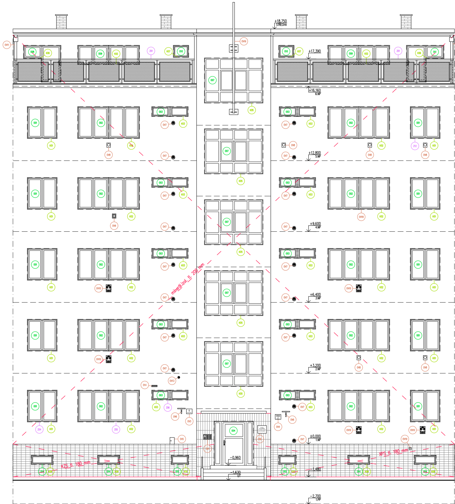
POHLED SEVEROVÝCHODNÍ – NAVRHOVANÝ STAV